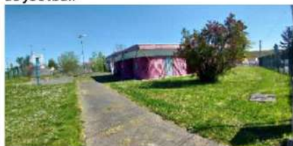
Implantation actuelle du bâtiment du « Mille clubs »