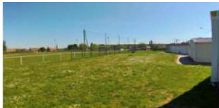
Point de vue ouest sur le site depuis le terrain de football