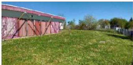
Vue est sur le « Mille clubs » et les tennis en friche