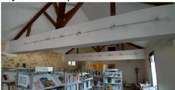
Intérieur de la bibliothèque