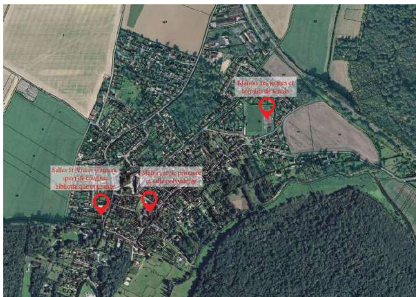
Figure 1- Localisation des sites sur la commune

La Commune souhaite, sur ces trois sites, analyser leurs usages et leurs fonctions au regard des besoins des habitants afin de projeter leur devenir.