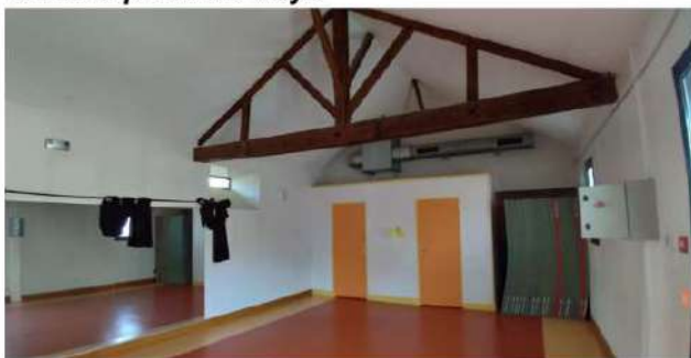
Intérieur de la salle de danse