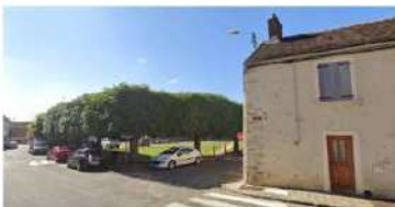
L'alignement de tilleuls de la place de la mairie