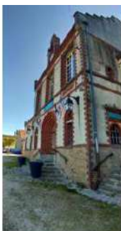
La façade principale de la mairie donnant sur la place publique