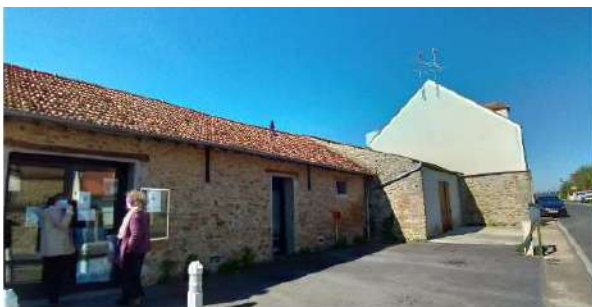
Vue sur la façade du bâtiment avec en premier plan l'entrée de la bibliothèque, et en fond un local pouvant évoluer