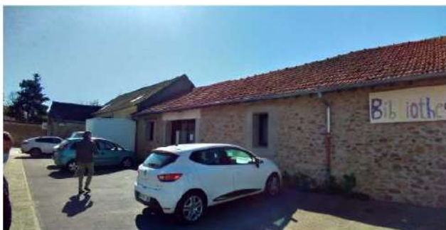
Vue sur l'espace de stationnement, la façade avec l'entrée de la salle de danse et en arrière-plan du dojo